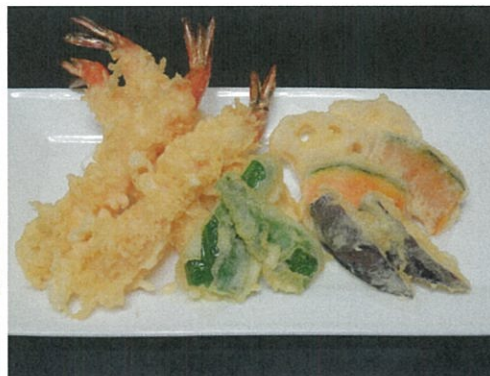
大海老入り 天ぷら盛合せ 918円 (税込)