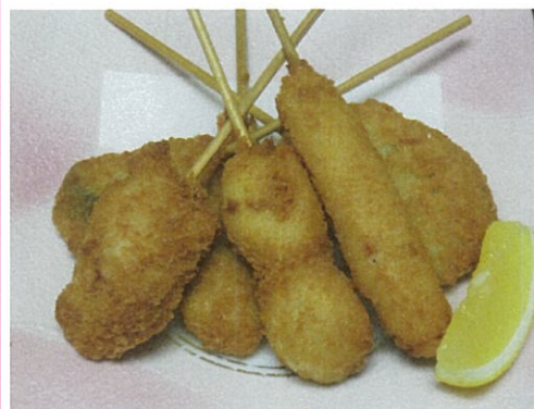
串揚げ6種盛り 650円 (税込)