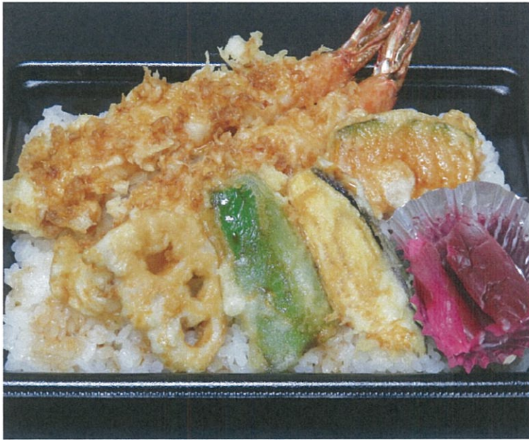
大海老天重弁当 1,080円(税込)