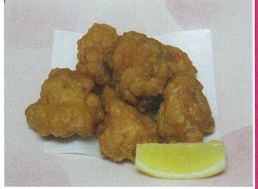
若鳥の唐揚げ 540円 (税込)