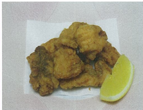
あんこうの唐揚げ 648円 (税込)