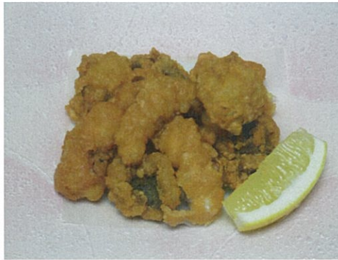
たこの唐揚げ 540円 (税込)