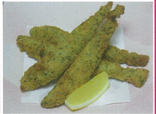
ししゃも磯辺フライ 648円 (税込)