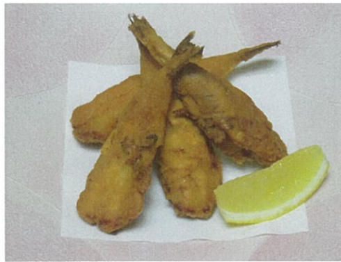
子フグの唐揚げ 800円 (税込)