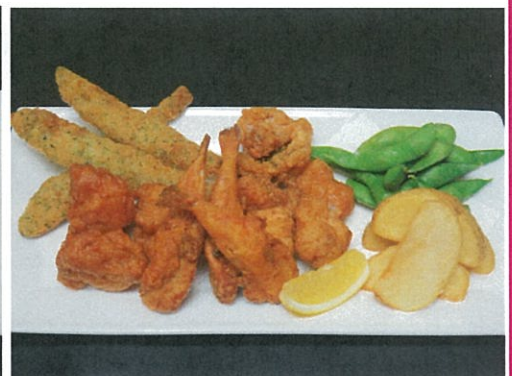
おつまみ盛合せ 1,296円 (税込)